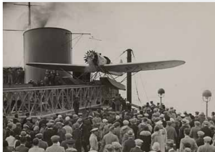
Katapult-Flugzeug vor dem Start

Ort Focke-Museum, Schwachhauser Heerstraße 240