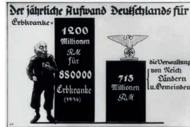
Diffamierung von Menschen mit psychischen Erkrankungen Plakat der „Aktion T4“

Im Frühjahr 1939 begannen die Morde an Kindern mit körperlichen oder geistigen Gebrechen; 1940 sollten ihnen die Patienten der Heil- und Pflegeanstalten folgen. Hier wurde erstmals mit der Massentötung durch Gas experimentiert. Bis 1945 fielen der sogenannten „Aktion T4“ mehr als 200.000 Menschen zum Opfer.