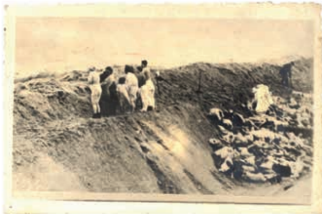
Massenerschießungen in den Dünen von Šķēde bei Liepāja (Lettland) vom 15. -17. Dezember 1941 (15. Dezember 1941)

Neben Minsk rollten nun die Deportationszüge aus dem Reich auch in Richtung Riga mit insgesamt etwa 16.000 Männern, Frauen und Kindern. Im Ghetto angekommen, fanden sie in den Unterküften die Spuren der im Wald von Rumbula ermordeten lettischen Juden. Sofort organisierte Jeckeln die Ermordung der „Reichsjuden“ im Wald von Bikernieki. Nur wenige Gefangene überlebten das Grauen im Ghetto oder in Lagern, wie Jungfernhof, Kaiserwald und Salaspils.