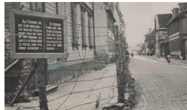
Ghetto von Riga

Am 1. Juli 1941 hatten deutsche Truppen Riga eingenommen. Noch bevor die Eroberung von Riga abgeschlossen war, kam es zu Übergriffen von lettischen Nationalisten, bei denen mehr als 6.000 Juden ermordet, und vor den Toren der Stadt im Wald von Bikernieki verscharrt wurden. Nach dem raschen Aufbau einer Verwaltung begannen die Besatzer mit systematischen Judenverfolgungen in ganz Lettland. In den größeren Städten wurde die Einrichtung von Ghettos befohlen, in Riga war das am 21. Juli 1941. Gesunde und meist männliche Ghettobewohner wurden zur Zwangsarbeit in den Betrieben der Kriegswirtschaft gezwungen.