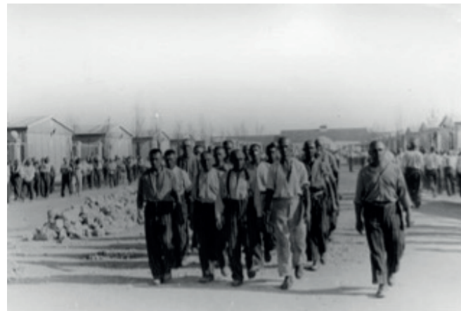
Konzentrationslager Dachau (28. Juni 1938)

Der Machtübernahme der Nationalsozialisten am 30. Januar 1933 folgte ein schrittweiser Ausbau der Diktatur unter der Führung von Adolf Hitler. Mit dem Reichstagsbrand vom 27. Februar 1933 wurden im Reich per Verordnungen wesentliche Grundrechte eingeschränkt. Gleichzeitig kam es zu Verfolgungen von Regimegegnern, Kommunisten, Sozialdemokraten und Gewerkschaftlern, die in rasch eingerichteten Konzentrationslagern, wie Dachau, interniert wurden. Zeugen Jehovas, Homosexuelle, sogenannten „Asoziale“ und engagierte Christen sollten schon bald folgen.