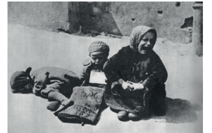
Kinder im Warschauer Ghetto

Der Wehrmacht folgten die aus verschiedenen Polizeieinheiten und der SS bestehende „Sonderseinheiten“, die sofort Jagd auf versprengte polnische Soldaten und die politische und geistige Elite machten. Über 60.000 von ihnen wurden ermordet.