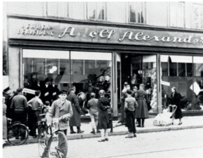
Reichspogromnacht in Bremen Bekleidungsgeschäft Alexander, Hastedter Heerstraße 313

den die staatsbürgerlichen Rechte von Juden stark eingeschränkt, bis hin zur späteren Aberkennung der deutschen Staatsbürgerschaft. Im November 1938 setzten organisierte SA-Trupps zahlreiche Synagogen, jüdische Gebetsstuben und Geschäfte in Brand. Am 10. November wurden ca. 30.000 Juden in Konzentrationslager inhaftiert. Hunderte Häftlinge wurden ermordet, starben an den Haftfolgen oder nahmen sich das Leben.