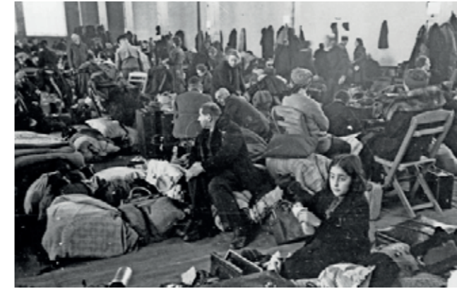
Warten auf den Abtransport in den Osten (Stuttgart, 1. Dezember 1941)

Reich ein, darunter auch ca. 500 jüdische Männer, Frauen und Kinder aus Bremen. Nur etwa 20 von ihnen überlebten das Grauen.