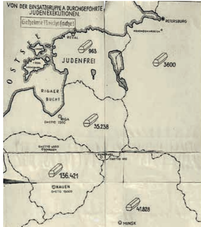
Landkarte zum „Stahlecker-Report“ vom 15. Oktober 1941