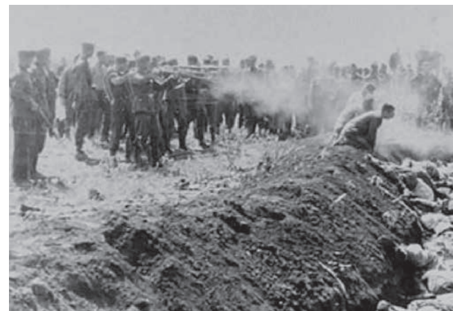
Massaker von Babyn-Jar vom 29. und 30. September 1941

Der hohe SS-Führer und Generalmajor der Polizei Dr. jur. Walter Stahlecker war als Leiter der Einsatzgruppe A verantwortlich für die Massenmorde in Weißrussland, dem Baltikum und Nordwestrussland. Voll Stolz meldete er am 15. Oktober 1941 im berüchtigten „Stahlecker-Report“ die Ermordung von über 200.000 Juden. Zur „Illustration“ fügte er eine Landkarte mit den Opferzahlen bei.