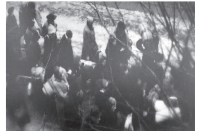
Heimlich fotografiertes Todesmarsch nach Rumbula (8. Dezember 1941)

Dann ließ Jeckeln im Ghetto die Nachricht verbreiten, dass eine Verlegung der Ghettobewohner in bessere Unterkünfte bevorstünde. Am 30. November 1941 wurden unter Mitwirkung von lettischen Hilfspolizisten etwa 13.000 Männer, Frauen und Kinder in Richtung Rumbula getrieben.